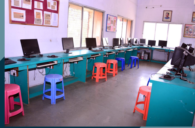
संगणक व भाषा प्रयोगशाळा