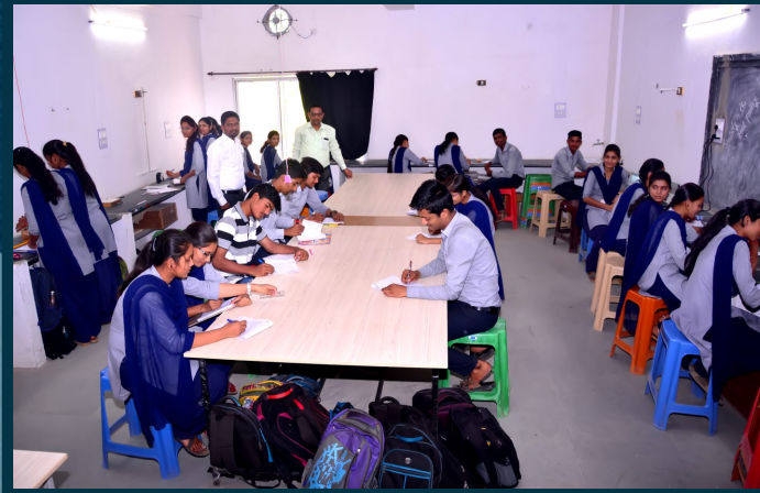
पदार्थ विज्ञान प्रयोगशाला