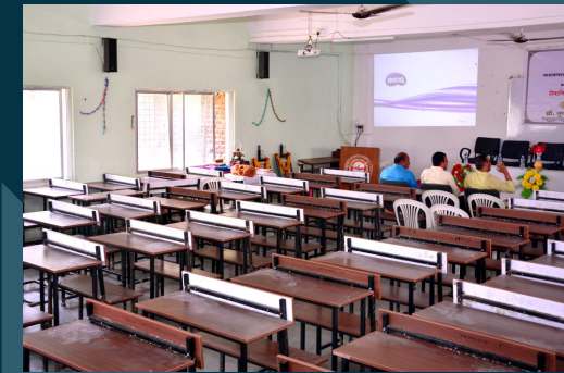
डिजीटल क्लास रुम