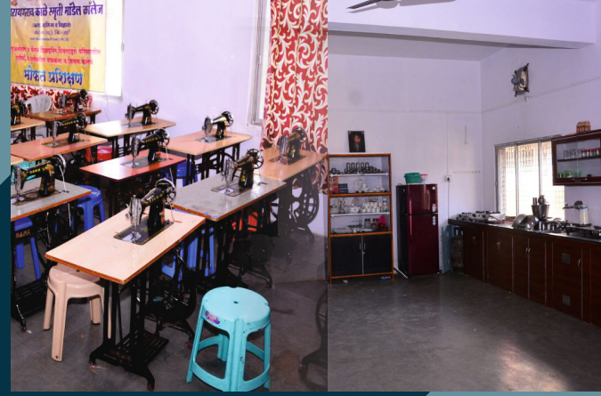
गृहअर्थशास्त्र व फॅशन डिजायनिंग प्रयोगशाळा